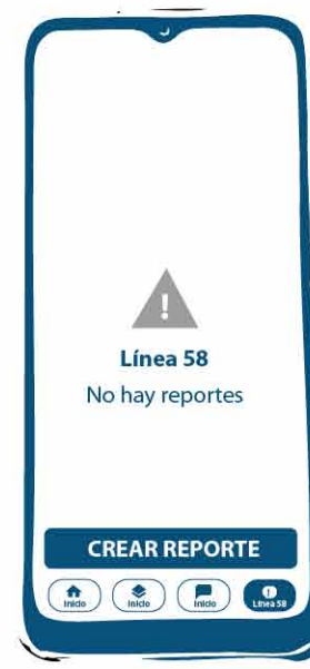
Seleccionas crear reporte