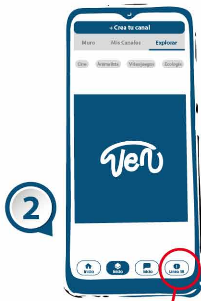
Seleccionas línea 58