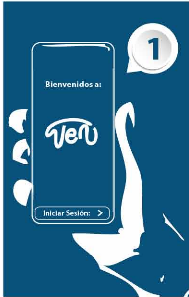
Entrar a la aplicación VENAPP