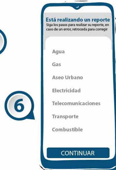
Seleccionas el servicio que desees