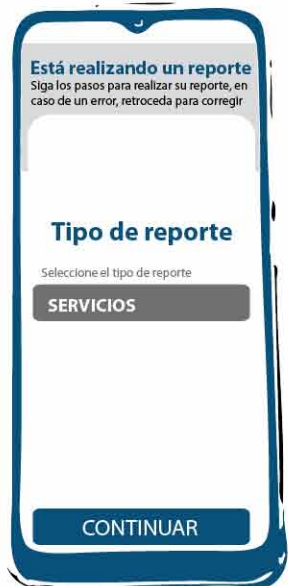
Seleccionas la opción servicios