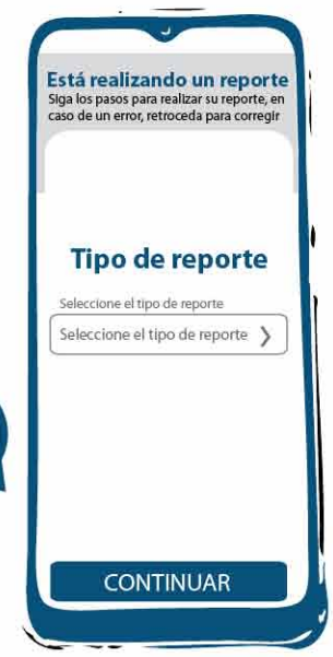
Seleccionas el tipo de reporte