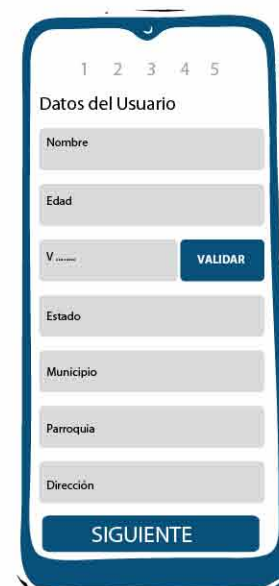
Completa los datos solicitados en los campos enumerados