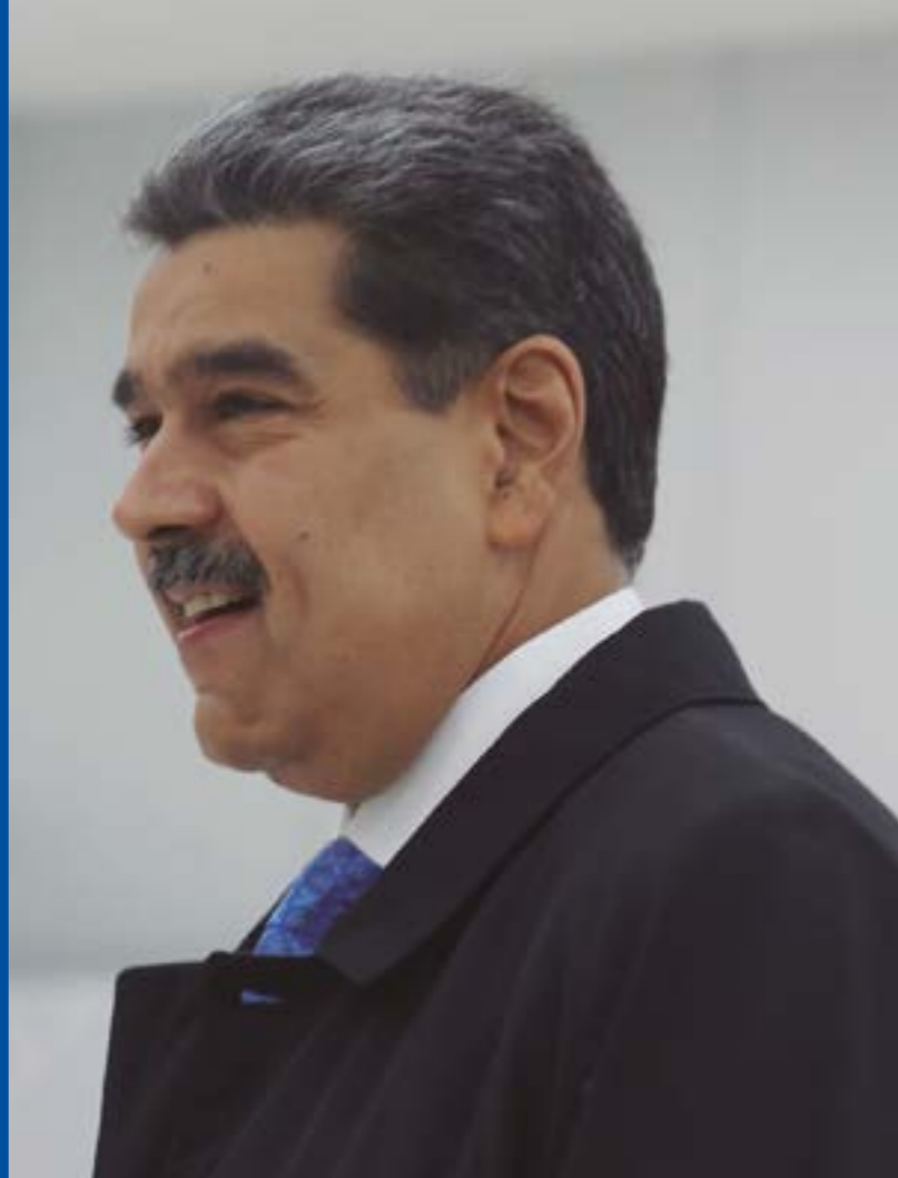
República Bolivariana de Venezuela

“Nos une una amistad de hierro y acero y vamos a mantenernos siempre en contacto”, afirmó el presidente Nicolás Maduro, al coincidir con las palabras de su par Xi Jinping, durante un fraterno encuentro.