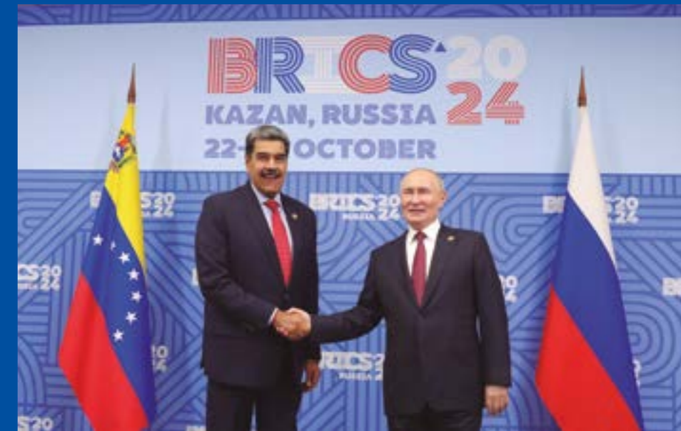
Presidente de la República Bolivariana de Venezuela, Nicolás Maduro Moros , y su homólogo de la Federación de Rusia, Presidente Vladimir Putin