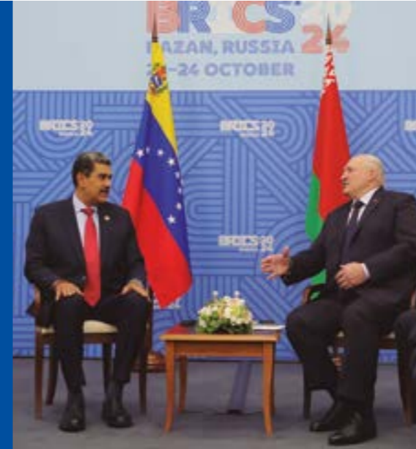
Presidente de la República Bolivariana de Venezuela Nicolás Maduro Moros , y su homólogo de Belarús, Aleksander Lukashenko

Nicolás Maduro Moros Presidente de la República Bolivariana de Venezuela