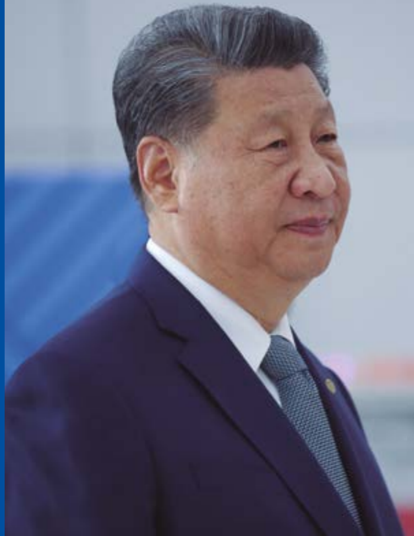
República Popular China