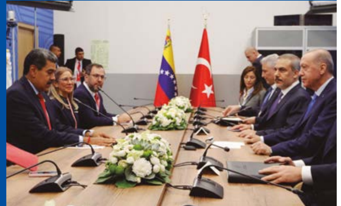
Presidente de la República Bolivariana de Venezuela, Nicolás Maduro Moros , y su homólogo de la República de Türkiye, Recep Tayyip Erdoğan